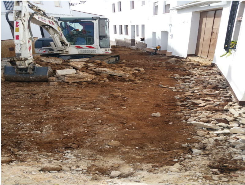
( http://www.berrocal.es/export/sites/berrocal/es/.galleries/imagenes-noticias/noticias-2016/IMG-20201029-WA0014.jpg )