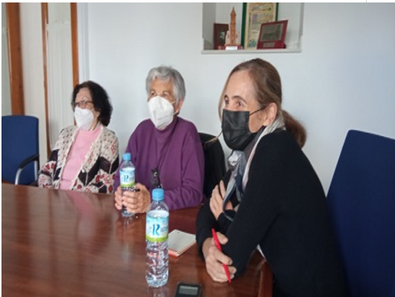
( http://www.berrocal.es/export/sites/berrocal/es/.galleries/areas-tematicas/Imagenes-Ocio-y-Cultura/IMG-20220413-WA0031.jpg )