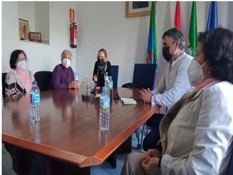
( http://www.berrocal.es/export/sites/berrocal/es/.galleries/areas-tematicas/Imagenes-Ocio-y-Cultura/IMG-20220413-WA0029.jpg )