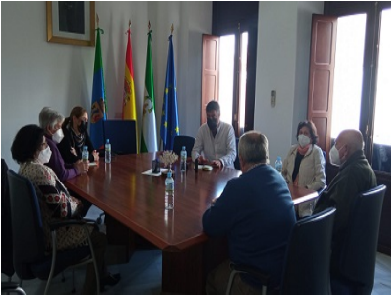
( http://www.berrocal.es/export/sites/berrocal/es/.galleries/areas-tematicas/Imagenes-Ocio-y-Cultura/IMG-20220413-WA0023.jpg )