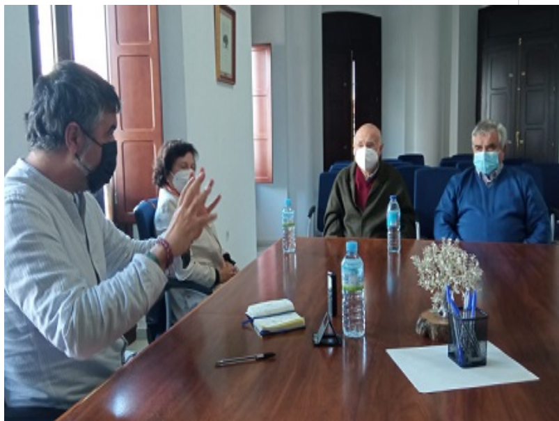
( http://www.berrocal.es/export/sites/berrocal/es/.galleries/areas-tematicas/Imagenes-Ocio-y-Cultura/IMG-20220413-WA0027.jpg )